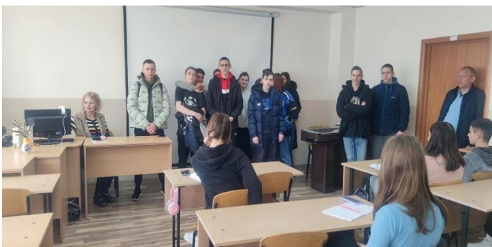
11.04.2023 Благодійна акція Паска для солдата