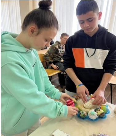
Оформлення тематичних вітрин