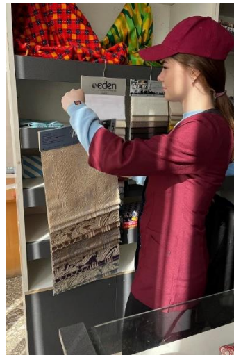
Вивчення асортименту непродовольчих товарів