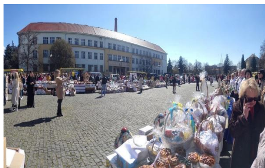
26.04.2023- Перевірні роботи